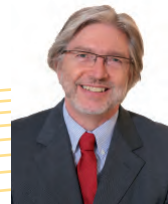
GASTON GREIVELDINGER - bourgmestre

longtemps sur des eaux calmes en continuant à suivre le seul cap qui peut être le sien : la réussite de tous nos élèves. Tous doivent être accompagnés également pour la préparation d'un diplôme, en développant leurs capacités d'autonomie et d'adaptation ainsi qu'en élevant leur niveau d'instruction et de culture.